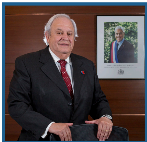
Horacio Bórquez Conti Director Nacional SAG

El SAG como Autoridad Nacional de Notificación MSF de Chile, está comprometido con promover la transparencia del comercio internacional. El diálogo y la transferencia de experiencias, es el camino que permitirá armonizar las herramientas para apoyar en mejor forma el crecimiento del sector silvoagropecuario, altamente dinámico y esencial para el bienestar de la población.