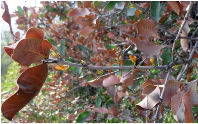
Figura 3. Rama de litre donde se observan las hojas afectadas adheridas a la rama y la proliferación de nuevos brotes.