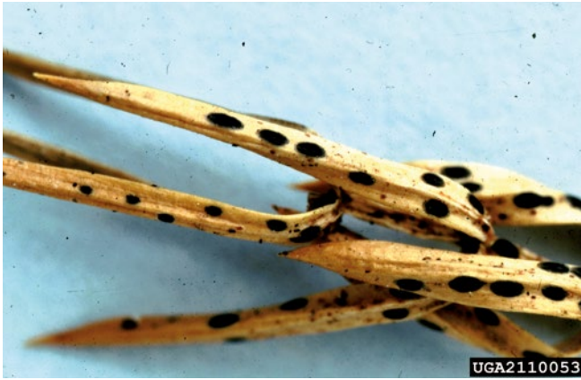
Figura 9. Apotecios de Lophodermium juniperinum en acículas de Juniperus spp.