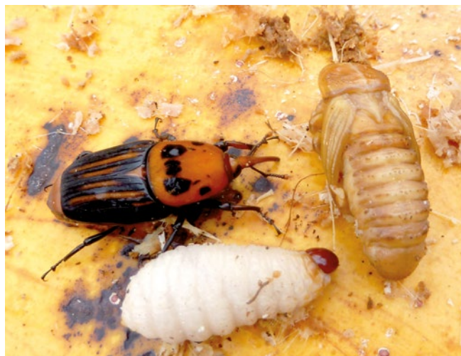
Figura 21. Adulto, larva y pupa de Rhynchophorus ferrugineus

En Chile podría afectar las diferentes especies de palmeras introducidas que son utilizadas con fines ornamentales y, además tendría el potencial de adaptarse a las únicas dos especies nativas clasificadas en géneros monotípicos, las cuales son endémicas y en estado de conservación amenazadas, la primera especie corresponde a Juania australis , presente sólo en el Archipiélago Juan Fernández, y la segunda es Jubaea chilensis , presente en lugares focalizados entre la Región de Coquimbo y la Región del Maule y como especie ornamental en otras regiones del país.