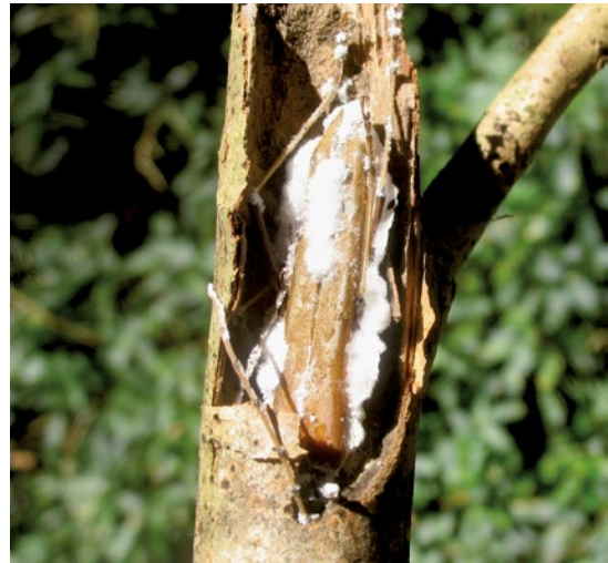
Figura 17. Adulto de Holopterus annulicornis (Col., Cerambycidae) muerto por el accionar de hongos entomopatógenos.