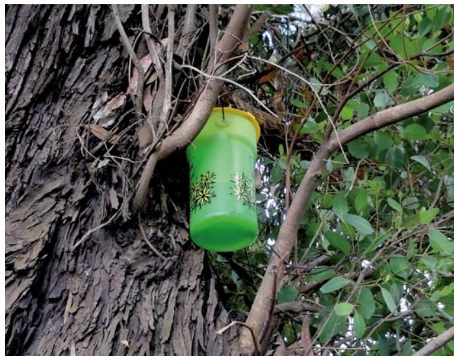
Figura 14. Trampa de detección de la avispa Chaqueta amarilla.

Vespula germanica es un insecto omnívoro que se ha dispersado en países de todos los continentes, se encuentra ampliamente distribuida en Chile continental y tam-