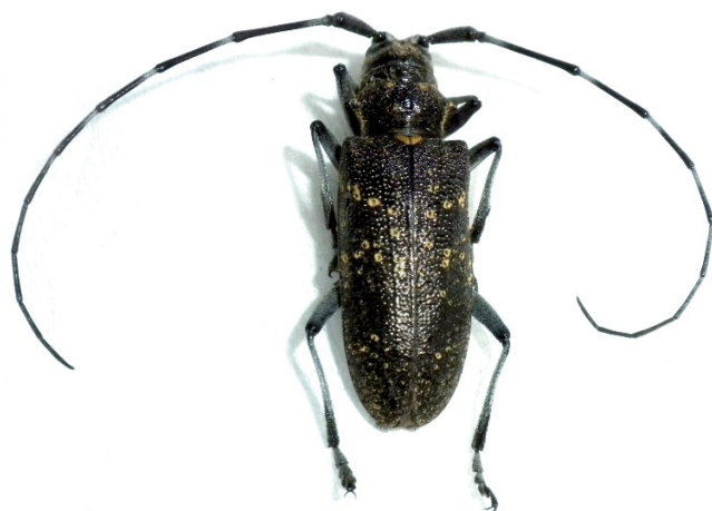
Figura 20. Adulto de Monochamus sutor .