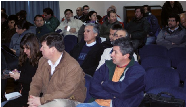
Figura 4. Taller "Cancro resinoso en viveros de pino"

Durante el mes julio de 2011 el SAG capacitó por segunda vez consecutiva a viveristas forestales en prevención y