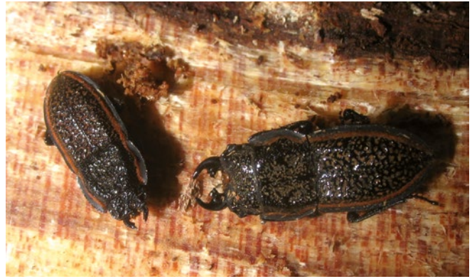
Figura 16. Hembra y macho de Erichius caelatus .

bién en la isla Robinson Crusoe del Archipiélago Juan Fernández, Región de Valparaíso. No obstante se encuentra ausente de Isla de Pascua, Región de Valparaíso. De esta forma, y con el propósito de detectar en forma temprana esta plaga en la isla, se ha implementado desde el año 2010 una red de trampas en base a cebos alimenticios, las cuales son instaladas en la primavera alrededor de los dos posibles puntos de ingreso correspondientes al aeropuerto Mataverí y el puerto Policarpo Toro, siguiendo el procedimiento elaborado por el SAG para este tipo de trampas, obteniéndose como resultado la ausencia del insecto, por lo que se mantiene la condición de libre de la plaga en Isla de Pascua.