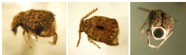
Figura 6. Adulto de Specularius sp.

Recientemente se ha identificado el insecto Specularius sp., capturado en una trampa de luz instalada en la Isla de Pascua, Región de Valparaíso. Las diferentes especies de este insecto son nativas de ambientes tropicales o subtropicales, desarrollándose en semillas de Fabáceas de los géneros Erythrina , Rhynchosia y Psophocarpus , no representando un riesgo para el recurso forestal de Chile.