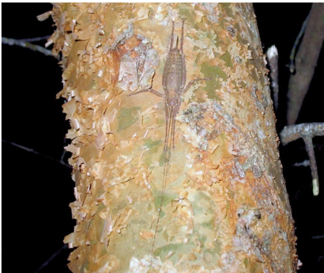
Figura 15. Hembra adulta de Polycleptidella chilensis mimetizada sobre la corteza de arrayán.

Durante el mes de marzo del año 2011, se visitó isla Mocha, la cual se encuentra situada a 35 km frente a la costa de Tirúa, Región del Biobío. En la visita se realizó vigilancia fitosanitaria forestal en uno de los bosques nativos de arrayán ( Luma apiculata ) más longevos y menos intervenidos por el hombre, además de utilizar medios de capturas de insectos nocturnos y de suelo, colectándose desde fitófagos nativos poco conocidos como Polycleptidella chilensis (Orthoptera, Tettigoniidae), descrita por primera vez el año 1962 para la Región de Lagos, hasta insectos más comunes como los degradadores nativos de la madera, donde destaca el lucánido Erichius (= Pycnosiphorus ) caelatus (Coleoptera, Lucanidae), además se observó el accionar de controladores naturales, sin detectar plagas introducidas.