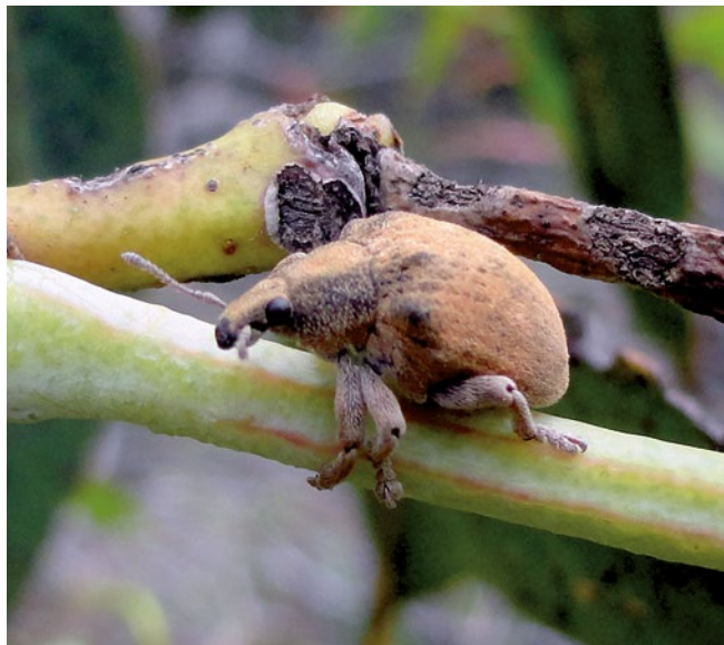
Figura 8. Adulto de Gonipterus scutellatus .

Durante el presente año 2011 fue detectado en Isla de Pascua, Región de Valparaíso, G. scutellatus asociado a Eucalyptus sp., ampliándose su distribución que correspondía sólo a Chile continental entre las Regiones de Coquimbo y de Los Ríos.