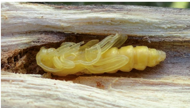
Figura 10. Pupa de Drascalia praelonga en el interior de su galería.

Este insecto nativo ha sido reportado entre las provincias de Huasco, Región de Atacama y Talca, Región del Maule, y también en Neuquén, Argentina, cuyos hospedantes no han sido publicados. Por otro lado, coleccionistas particulares han criado este insecto desde ramas muertas de Kageneckia sp. y de Quillaja saponaria , los que corresponden a sus hospedantes nativos. No obstante, durante el mes de agosto del 2011 se detectó por primera vez asociado a ramas de Ulmus sp. La detección ocurrió en la zona de la pre-cordillera de los andes, comuna de Machalí, Región de O'Higgins. Un mes más tarde en septiembre del 2011 se visitó nuevamente el sector y se corroboró su asociación a ramas y rebrotes muertos de Ulmus sp., caracterizándose el tipo de daño y los estados de larva, pupa y adultos obtenidos desde el interior de las ramas.