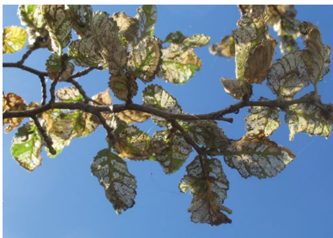
Figura 18. Daño en lenga provocado por microlepidóptero.