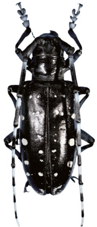
Figura 5. Adulto de Anoplophora glabripennis (Foto SAG Lo Aguirre)

Durante el mes de agosto del año 2011, en la Región el Biobío, se interceptó por primera vez en Chile ejemplares de A. glabripennis . La intercepción correspondió a adultos muertos presentes en el interior de embalajes de madera procedentes de China, adicionalmente, en esos embalajes también se interceptaron larvas vivas de cerambícidos, las cuales fueron dejadas en crianza, con el fin de obtener el adulto y proceder a su identificación a nivel de especie.