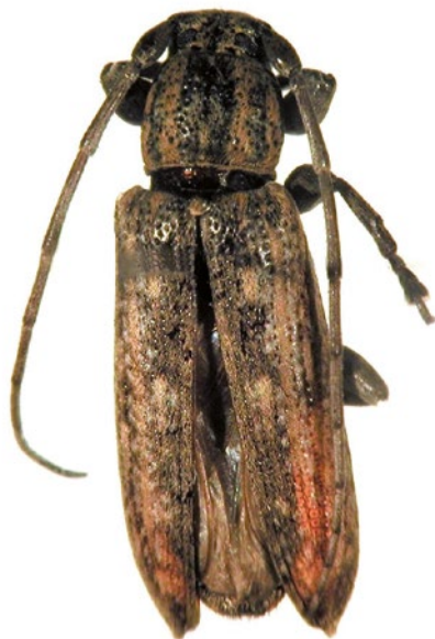
Figura 7. Adulto de Sybra sp.

Recientemente se ha identificado el insecto Sybra sp., capturado en una trampa de luz instalada en la Isla de Pascua, Región de Valparaíso. Estos insectos son nativos de ambientes tropicales o subtropicales, desarrollándose en tallos o ramas muertas y secas de diferentes especies exóticas cultivadas en ambientes tropicales, no representando un riesgo para el recurso forestal de Chile.