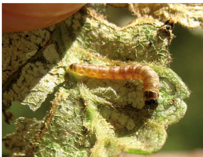
Figura 19. Larva de microlepidóptero causante de desfoliación en lenga.