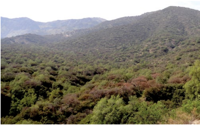
Figura 2. Vista general del bosque nativo en el sector San Carlos de Apoquindo, donde se observan litres con follaje de color café-rojizo.

por esta clorosis, pero se mantiene la observación y seguimiento de este problema para establecer si tiene un origen en factores bióticos.