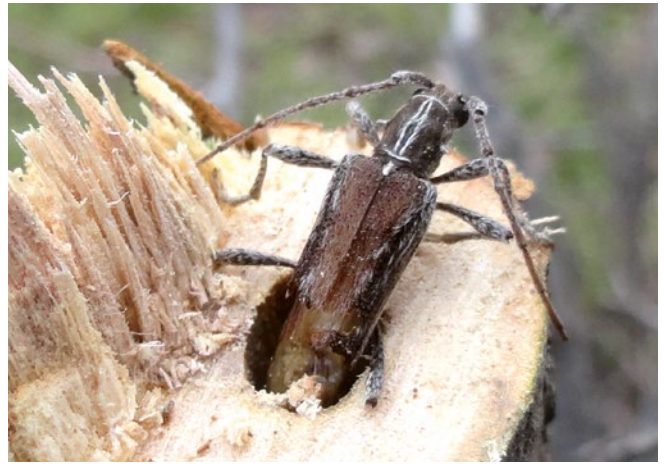
Figura 11. Adulto de Drascalia praelonga en su material hospedante.