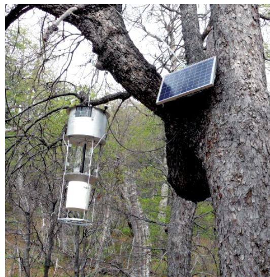
Figura 1. Trampa de luz a energía solar instalada en bosque.

bles. Actualmente se ha estado trabajando en la utilización de trampas de luz en base a energía solar, las cuales poseen tecnología moderna que ha permitido disminuir su peso, especialmente en lo relativo a los sistemas de almacenamiento de energía, lo que les entrega mayor movilidad en terreno, además de depender solamente de la luz solar como fuente de energía. Estas trampas actualmente se encuentran en etapa de pruebas de campo.